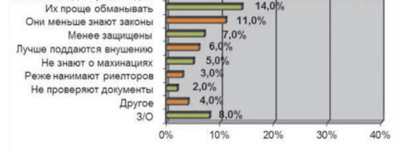
Как можно обезопасить пожилых людей от действий мошенников?